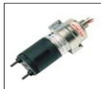
Detector de gás pontual infravermelho avançado